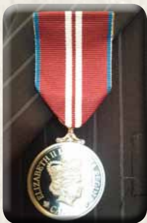
QUEEN ELIZABETH II DIAMOND JUBILEE MEDAL